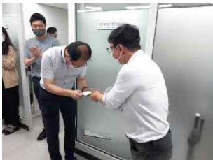
스마트시티 통합플랫폼 개발자 포상