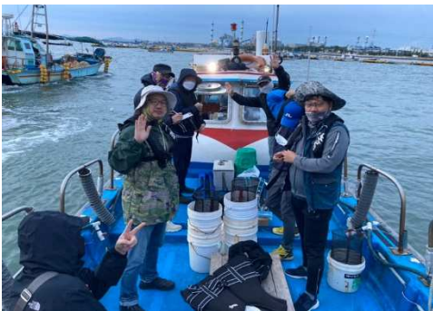
<JBT 사내 행사 소모임 쭈꾸미 낚시>