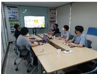
하천 점용관리 시스템 개발구축 프로젝트 회의